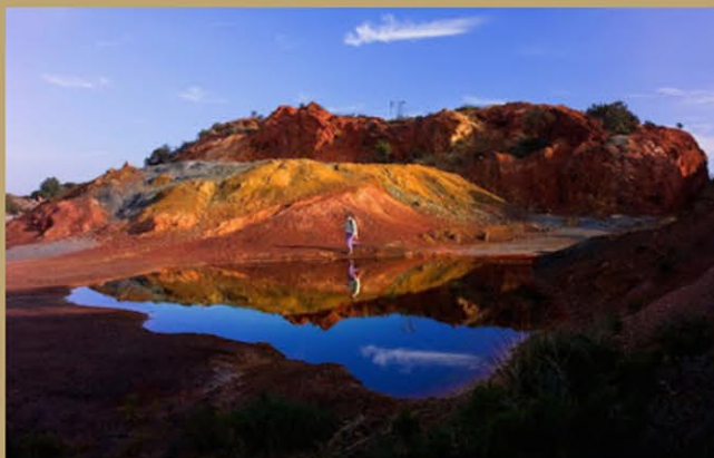
Miniera di Rio Albano

Una vacanza estiva all'Isola d'Elba è anche cultura, perché questa palestra outdoor pensa anche ad allenare la mente: